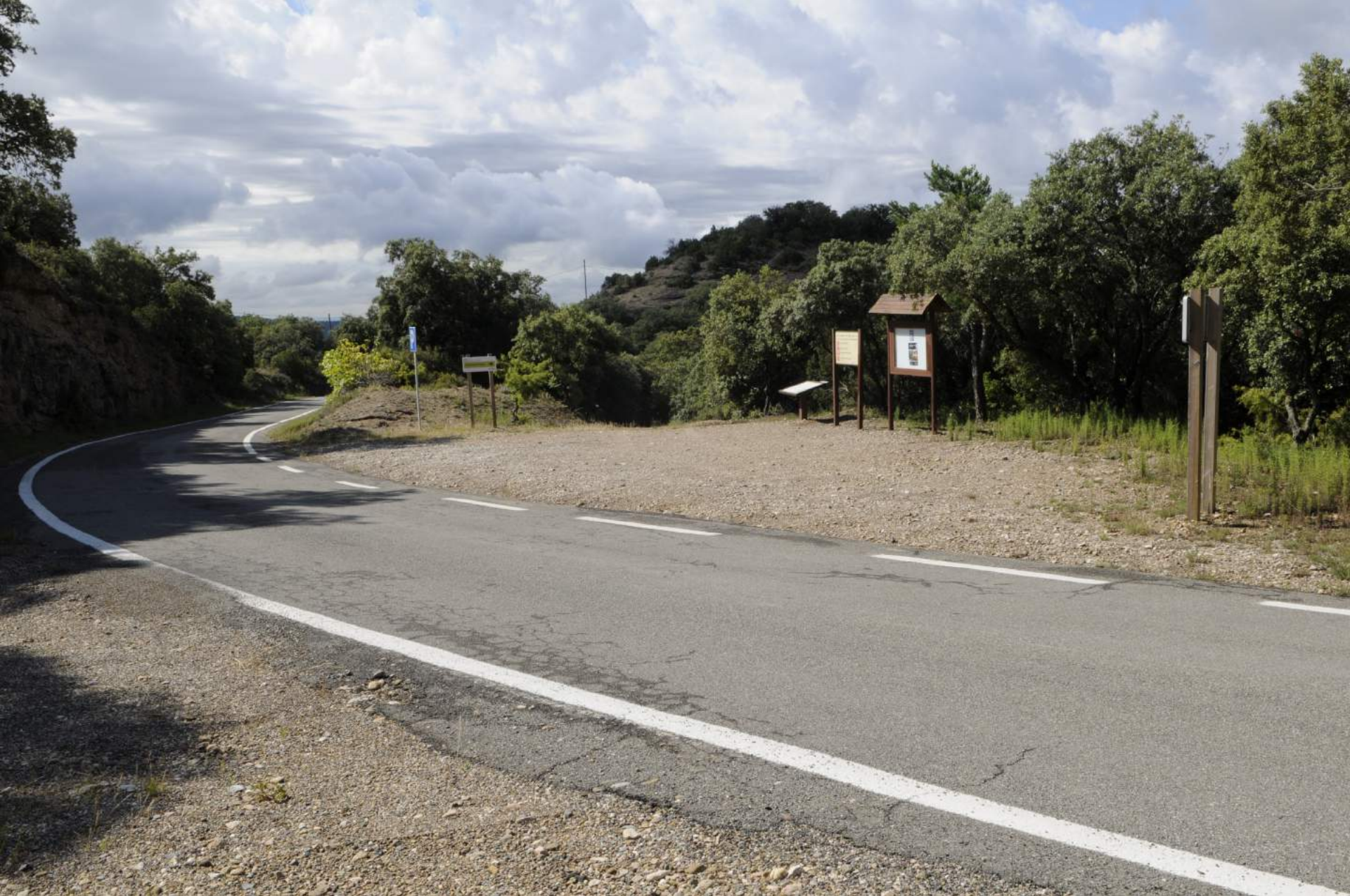
Punto de encuentro desde la A-2205 viendo desde Aínsa-Boltaña.