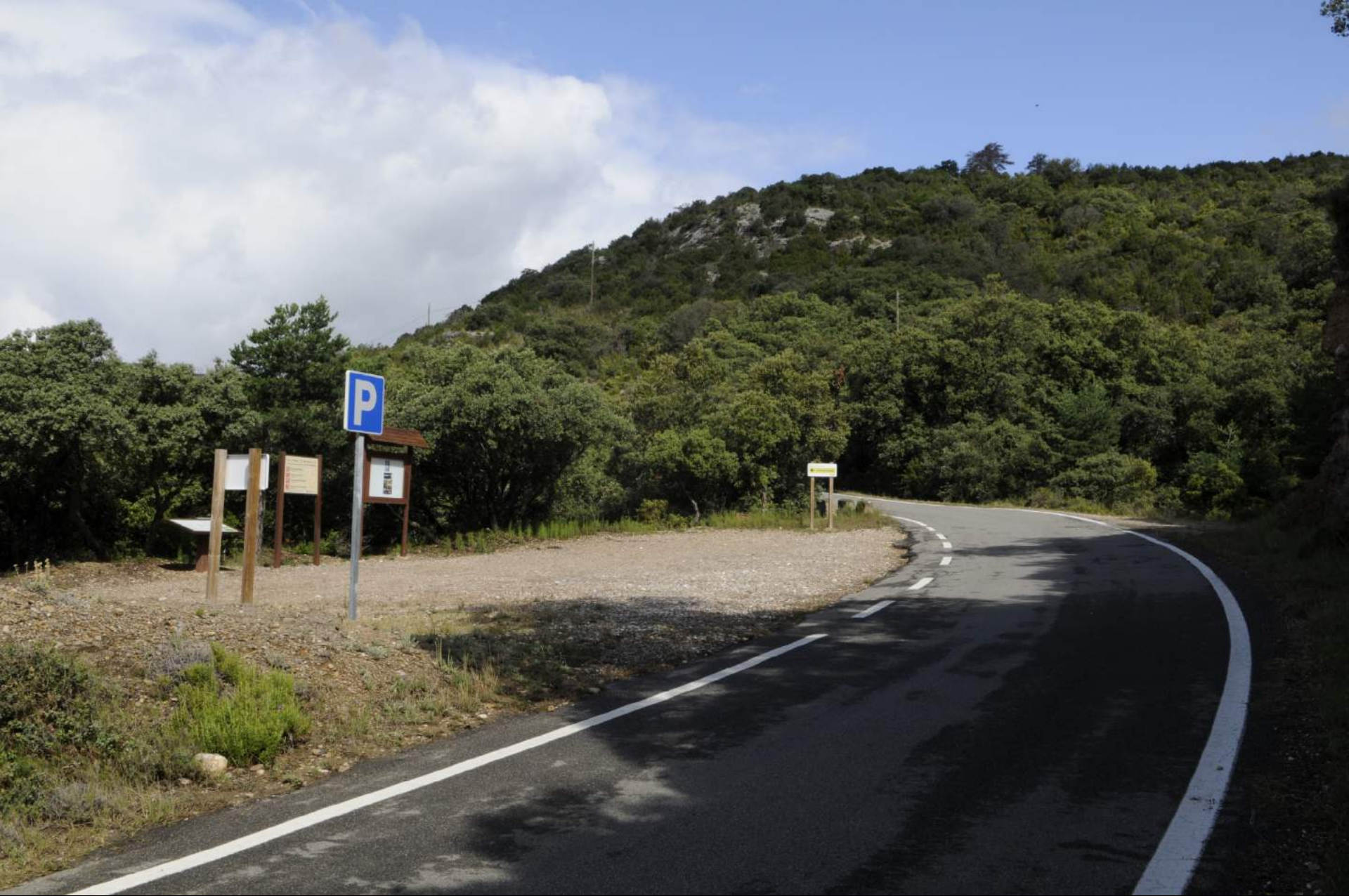
Punto de encuentro desde la A-2205 viendo desde Colungo.